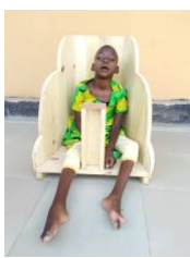
..aangepaste stoel voor een kind met epilepsie

Voor kinderen die niet naar school kunnen vanwege hun handicap, hebben we directe hulpprogramma's ingezet, met als uiteindelijk doel dat ze onderwijs kunnen gaan volgen en lotgenootjes op school kunnen ontmoeten.