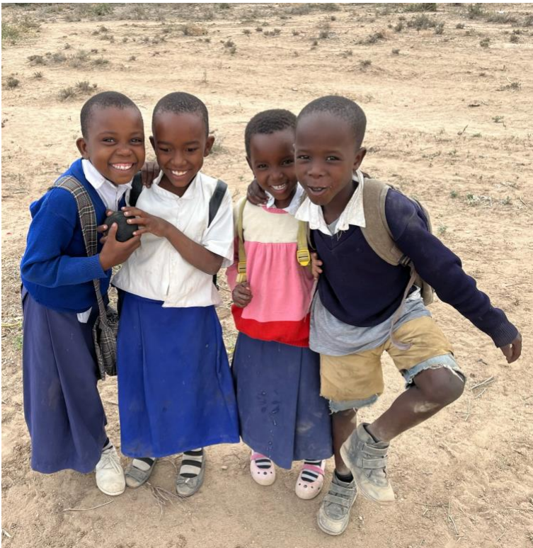
Ook deze kinderen staan te trappelen om naar school te kunnen.